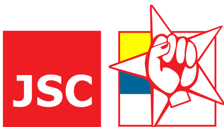
Juventudes Socialistas de Canarias