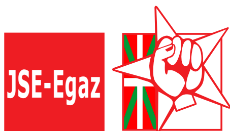
Juventudes Socialistas de Euskadi