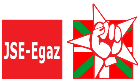
Juventudes Socialistas de Euskadi