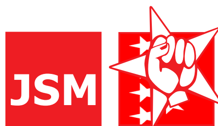
Juventudes Socialistas de Madrid