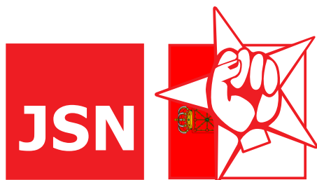
Juventudes Socialistas de Navarra