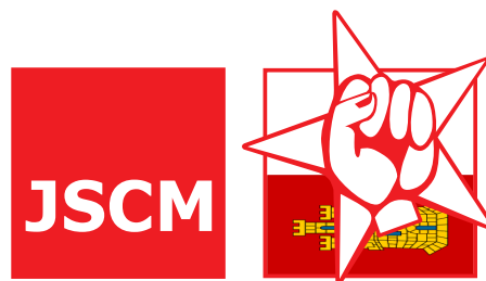
Juventudes Socialistas de Castilla-La Mancha