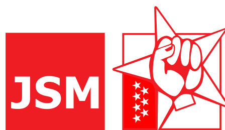
Juventudes Socialistas de Madrid