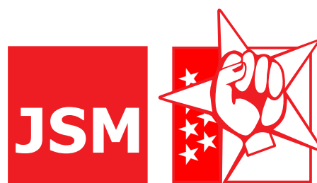
Juventudes Socialistas de Madrid